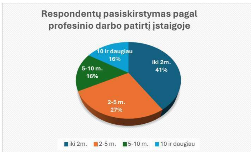
3 Pav. Respondentų pasiskirstymas pagal profesinio darbo patirtį (N =86)

Iš diagramos matyti, kad įstaigoje dirba nemaža dalis darbuotojų, kurių profesinio darbo patirtis iki 2 metų. Tai reiškia, kad įstaigai svarbūs šių darbuotojų socializacijos ir apmokymo klausimai.