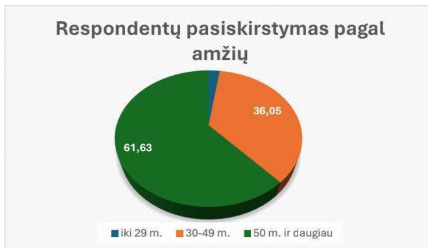
1 Pav. Respondentų pasiskirstymas pagal amžių (N =86)

Respondentų priskyrimas amžiaus kategorijai gali būti svarbus tuo klausimu, jei analizuojant konkrečius atsakymus išryškėtų tam tikra tendencija, pvz., kad jaunesni darbuotojai susiduria su konkrečiais sunkumais skirtingai nei vyresni. Arba priešingai - linkę greičiau spręsti konkretaus pobūdžio situacijas ir pan. Bendra informacija apibūdina įstaigoje dirbančių kontingentą ir leidžia daryti tam tikras prielaidas. Metams bėgant tobulėja žmogaus mąstymas, didėja patirtis, kaupiamos ekspertinės žinios ir išmintis. Tiek jauni, tiek vyresnio amžiaus darbuotojai nėra vienalytė grupė, tarp tos pačios amžiaus grupės asmenų gali būti esminių skirtumų. Vyresni darbuotojai paprastai jautriau reaguoja į kenksmingus darbo aplinkos veiksnius, jie greičiau pavargsta ir sunkiau atsigauna po darbo. Didžioji dauguma profesinių ligų diagnozuojama būtent vyresnio amžiaus darbuotojams, dažniau vyrams nei moterims (žr. 2 pav.).